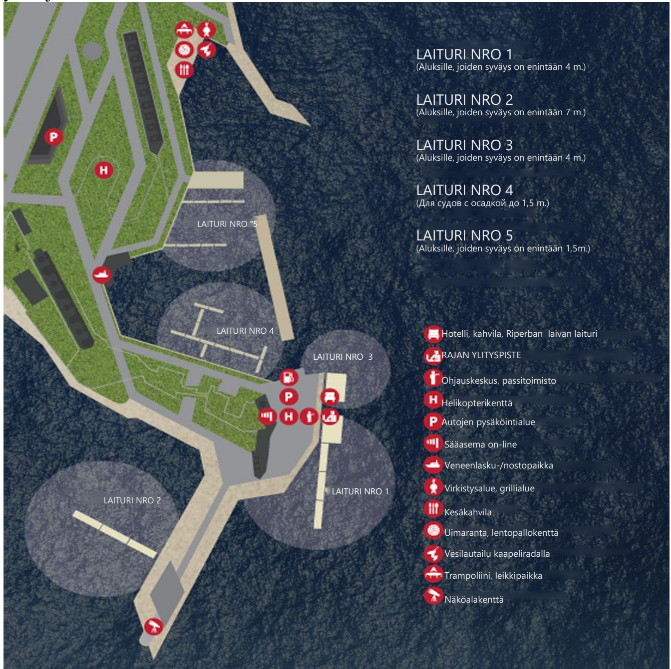
Kartta tarkastuspisteiden sijainnista satamassa Pietarin Suursatama

Terveyst- ja karanteenitarkastuksen tulokset todetaan siten, että kuljetusasiakirjoihin laitetaan asianmukaiset leimat ja Venäjän federaation lainsäädännön edellyttämässä tapauksissa laaditaan myös asianmukainen pöytäkirja.